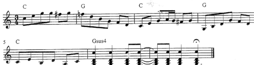
Imagen. 7.

326), los fa# son realmente bordaduras, la “tonalidad” que perfila el fraseo melódico es la de un sol mixolidio .