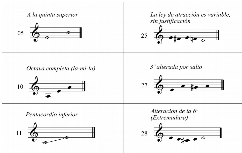
Gráfico 1. Modo de Mi . Algunas variantes melódicas (Donostia, 1946).