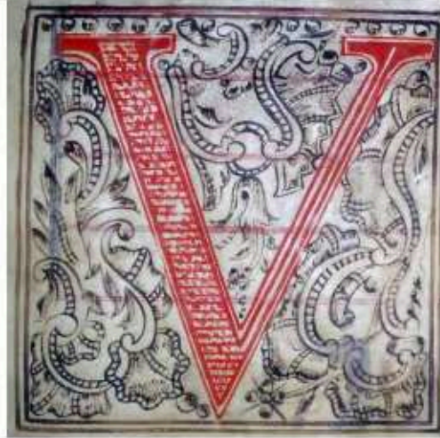
Lámina 2. Uncial del introito Venite filii , f 75v

In festo Sancti Iosephi a Cupertino Confessoris. Ad Missam Introitus