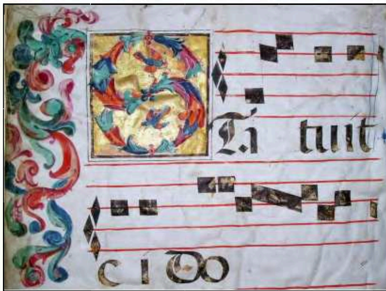
Lámina 1. Uncial del introito Statuit ei , f 1v