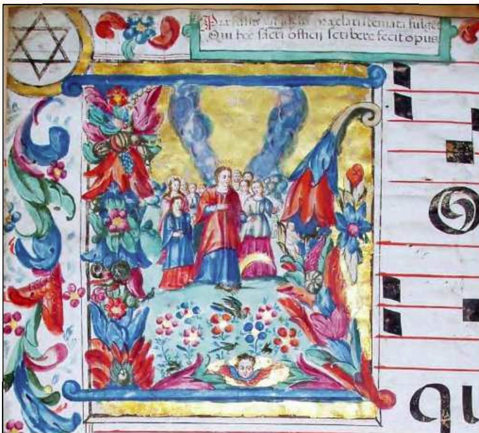
Lámina 1. Inicial del In. Loquebar y cartela, f 1v