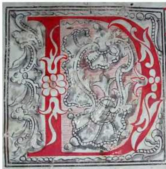
Lámina 3. Uncial del introito Dilecto Dei , f 80v