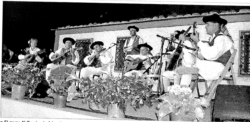
El grupo Al-Quaria, de Adra, durante su actuación