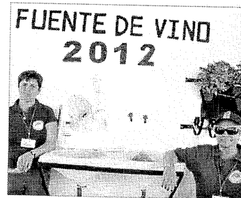
Las encargadas de la fuente del vino