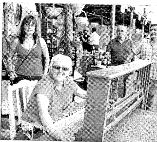
La As. Empresarios Alta Alpujarra y su telar / J.G.