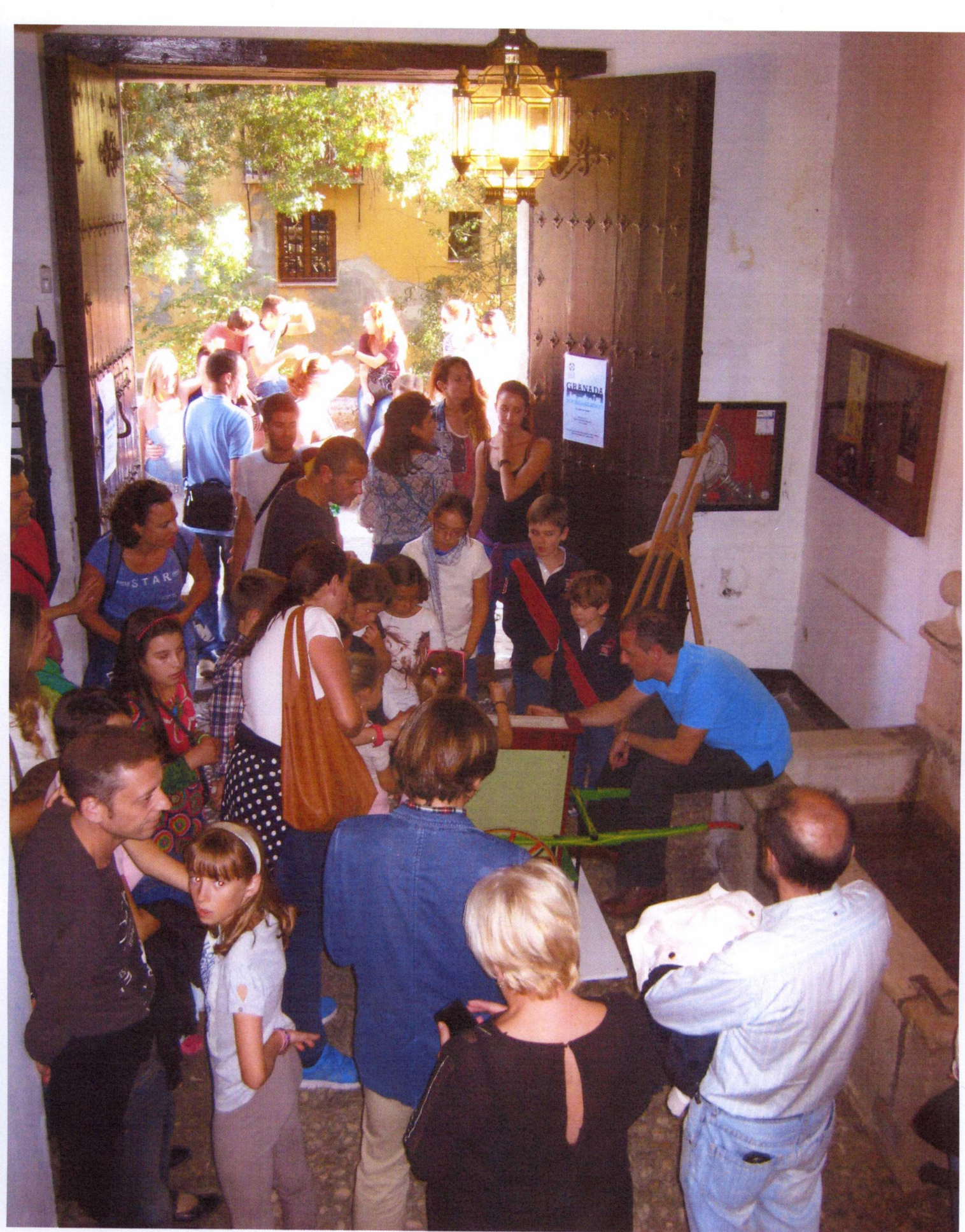
GRANADA. NOCHE EN BLANCO "LA LUNA EN VERSO" 19 DE OCTUBRE DE 2013