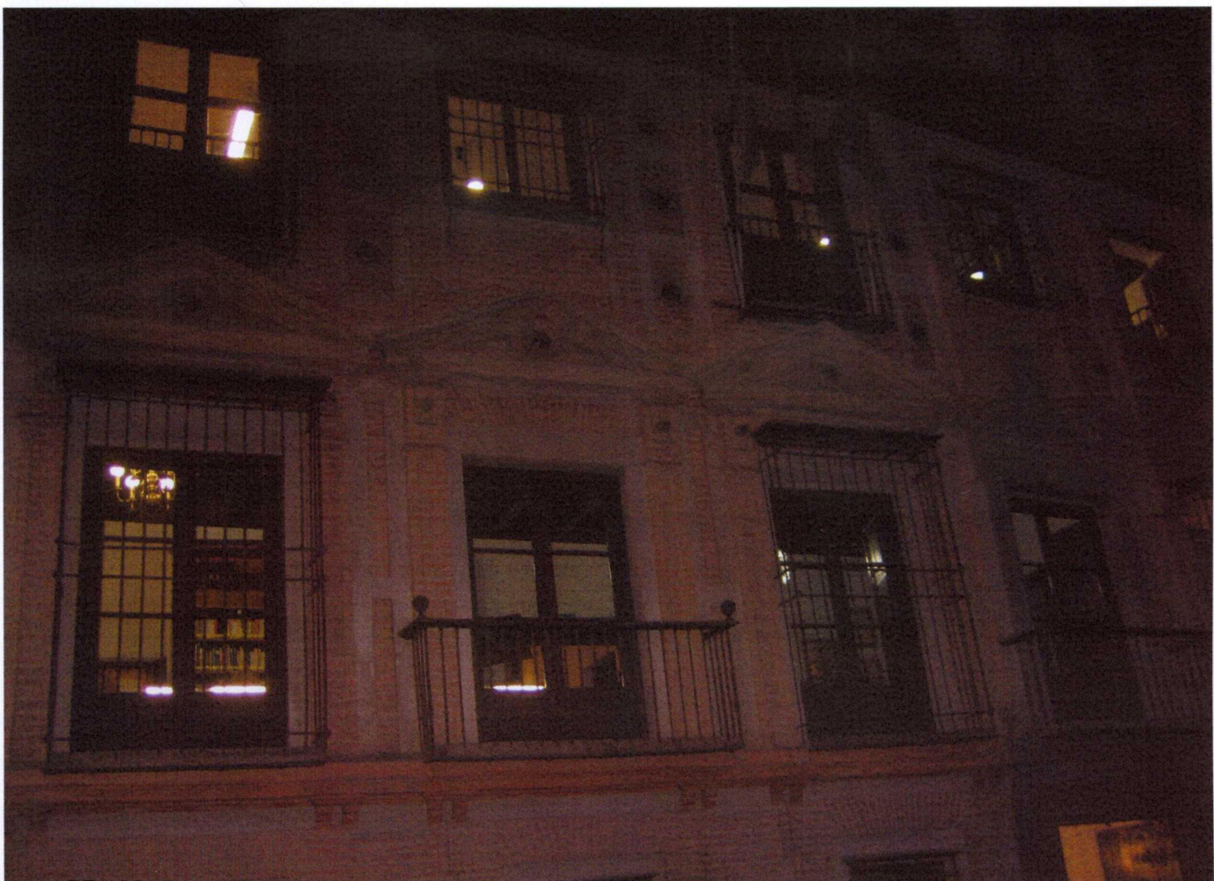
GRANADA. NOCHE EN BLANCO "LA LUNA EN VERSO" 19 DE OCTUBRE DE 2013