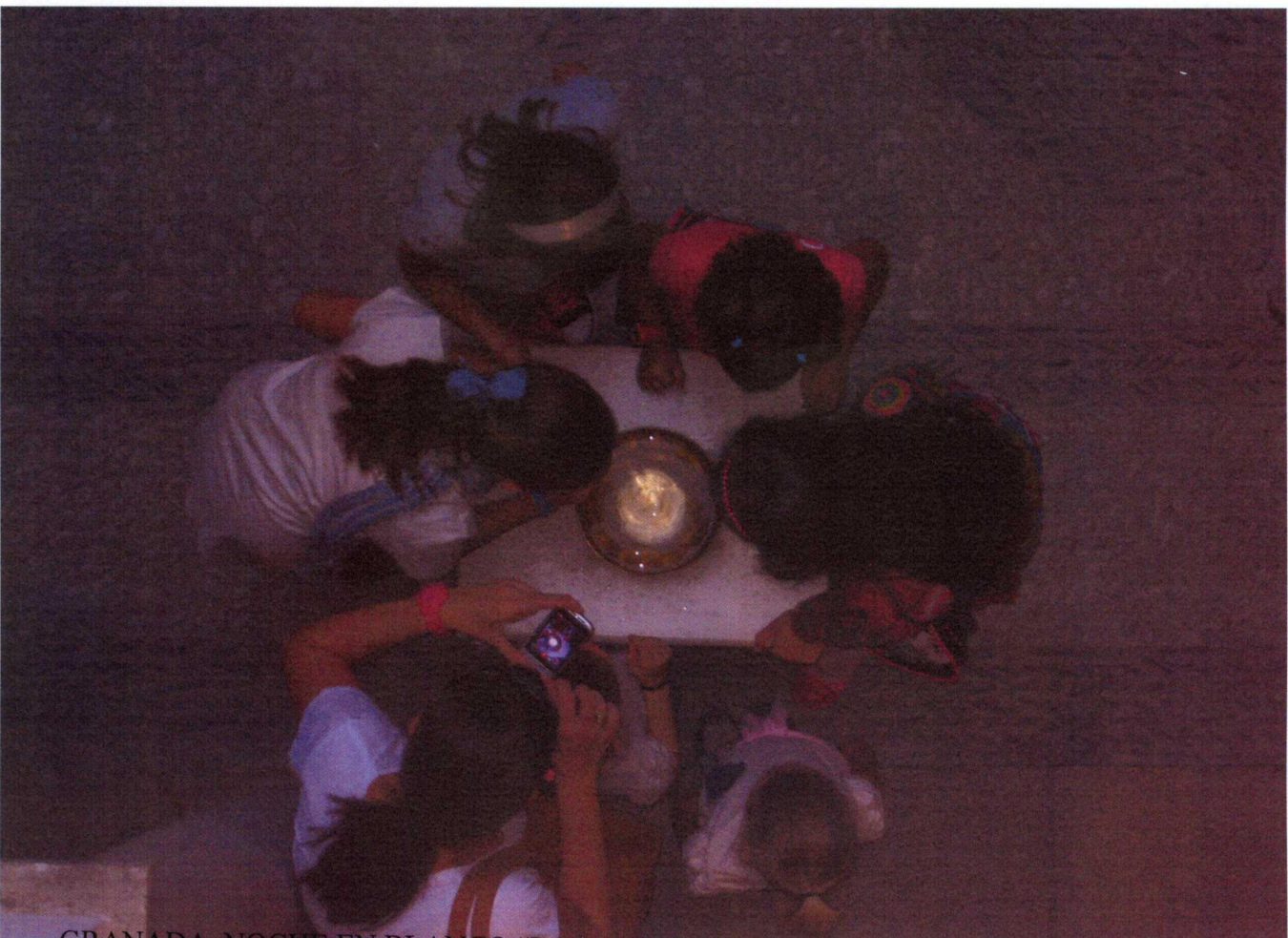
GRANADA. NOCHE EN BLANCO "LA LUNA EN VERSO" 19 DE OCTUBRE DE 2013