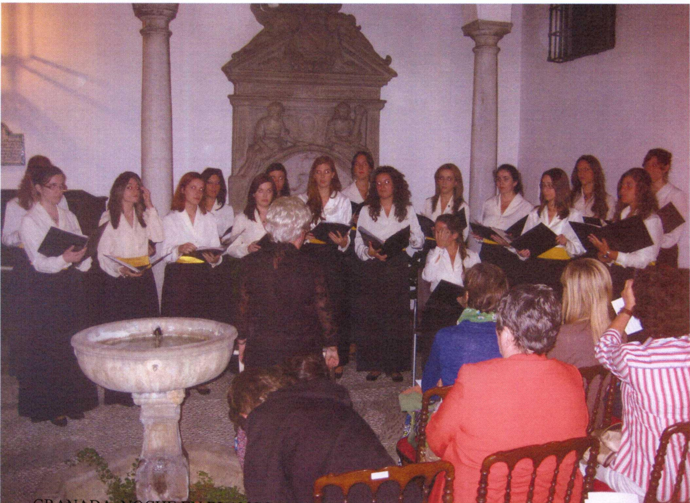
GRANADA. NOCHE EN BLANCO "LA LUNA EN VERSO" 19 DE OCTUBRE DE 2013