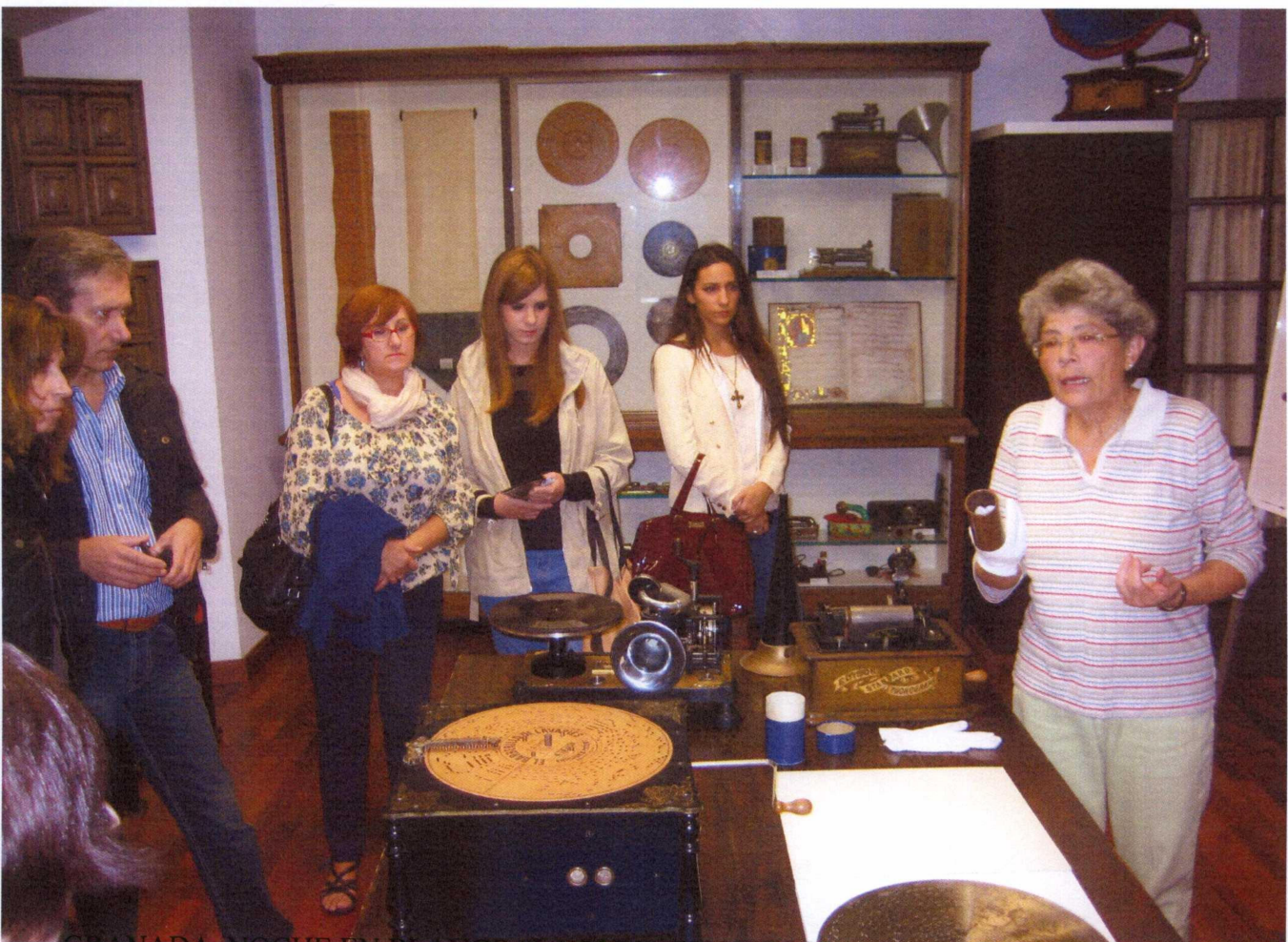
GRANADA. NOCHE EN BLANCO "LA LUNA EN VERSO" 19 DE OCTUBRE DE 2013