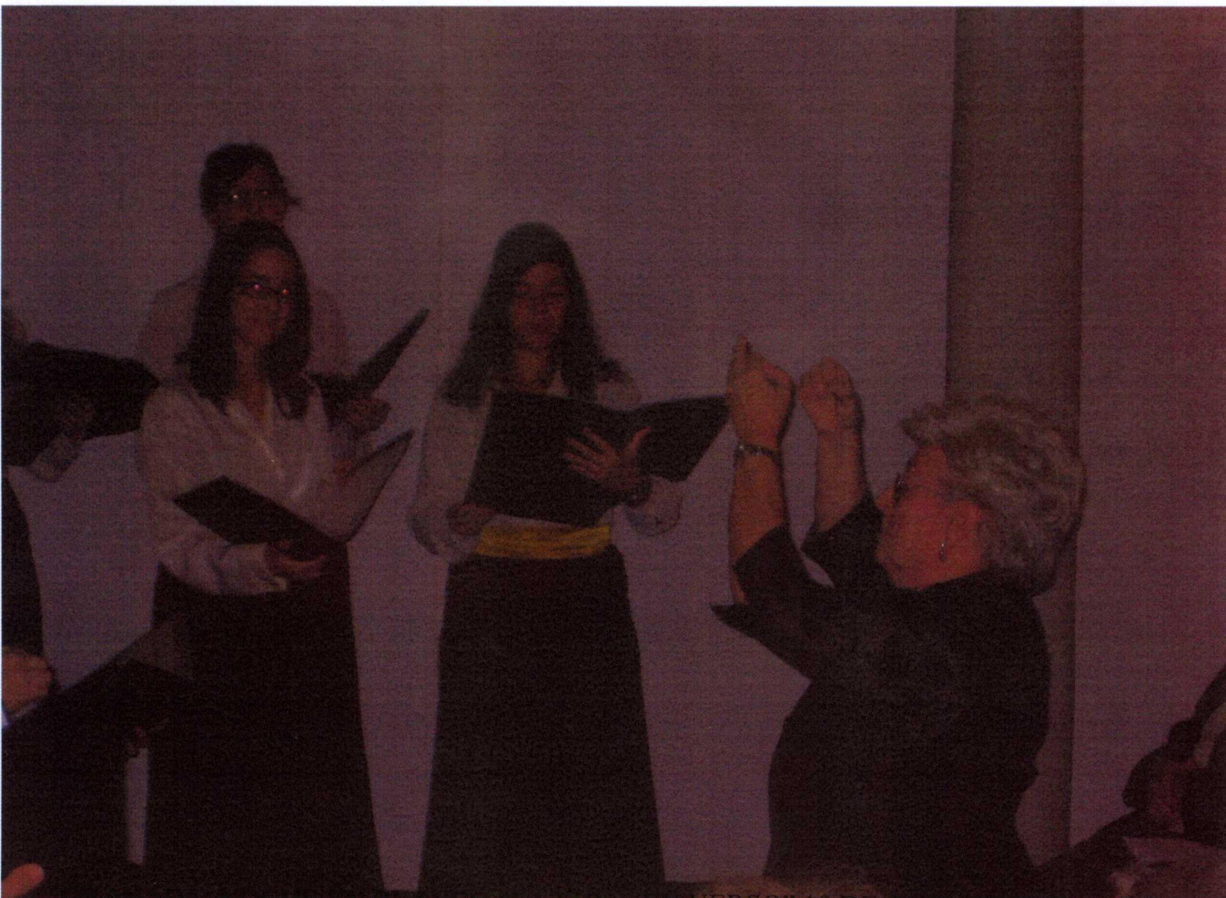
GRANADA. NOCHE EN BLANCO "LA LUNA EN VERSO" 19 DE OCTUBRE DE 2013