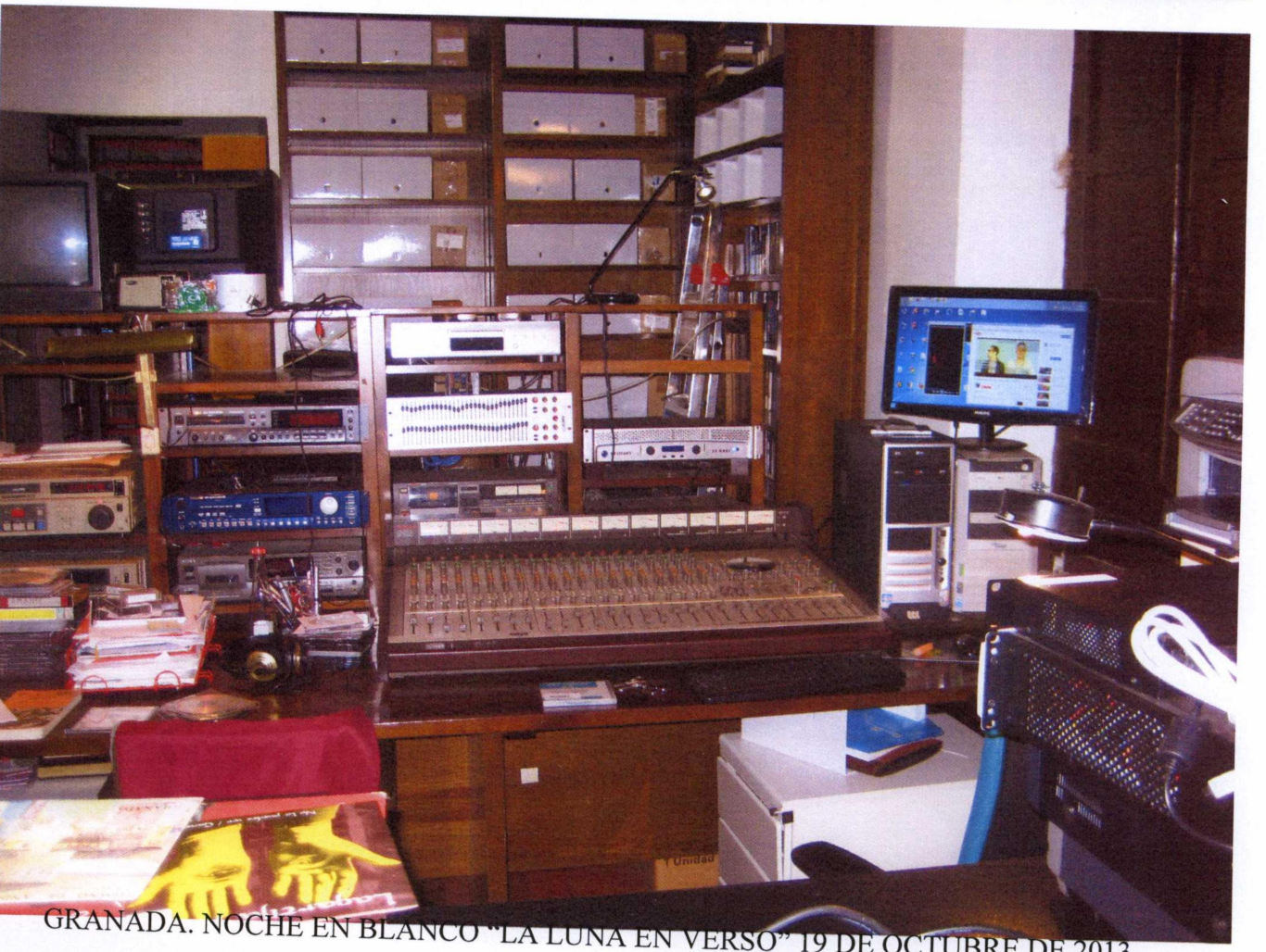
GRANADA. NOCHE EN BLANCO "LA LUNA EN VERSO" 19 DE OCTUBRE DE 2013