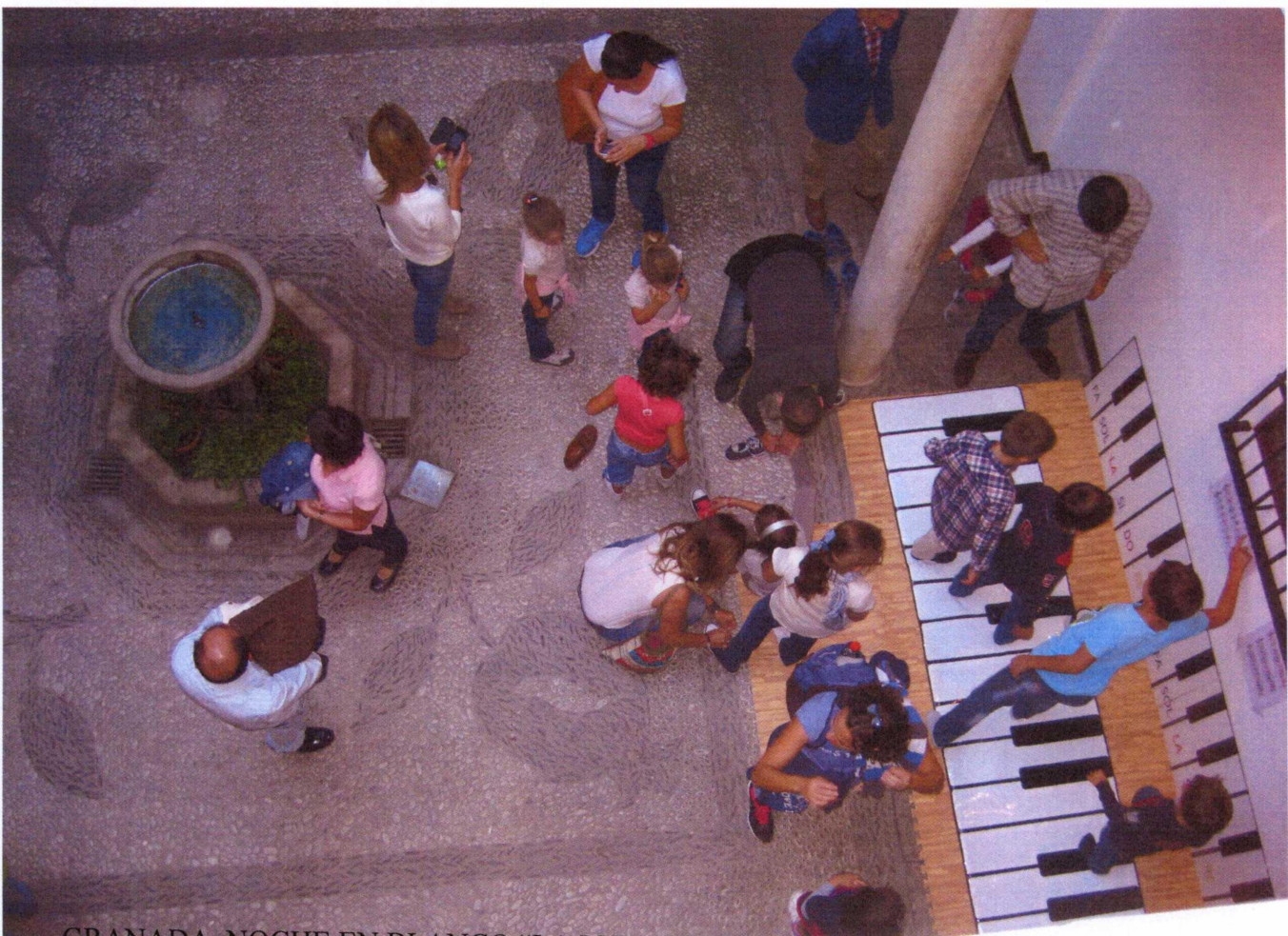
GRANADA. NOCHE EN BLANCO "LA LUNA EN VERSO" 19 DE OCTUBRE DE 2013