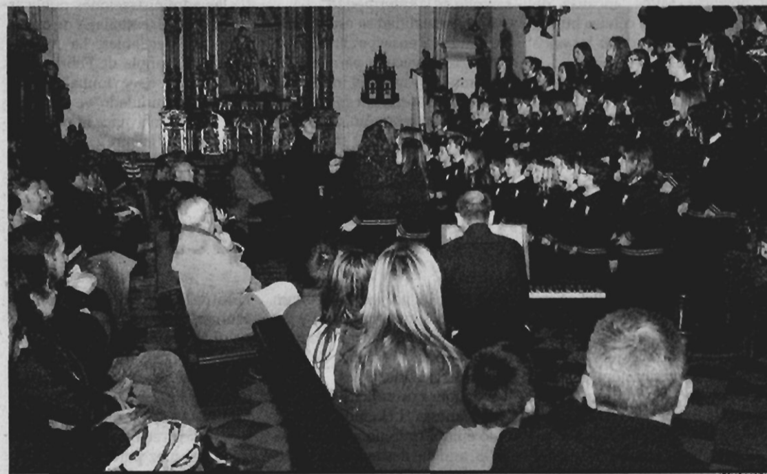
Corales gaditanas. La parroquia del Carmen acogió ayer la duodécima edición del Día de la Música con la actuación de seis corales gaditanas: Escolanía María Auxiliadora, Coro de Cámara Nova Mvsica, Coral Antares, Virelay, Coro Virgen del Patrocinio y Canticum Novum.