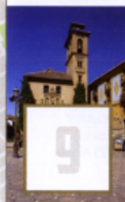
Iglesia San Gil y Santa Ana