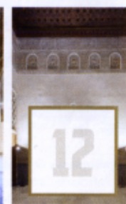
Cuarto Real de Santo Domingo

* Los organizadores se reservan el derecho a modificar el programa por necesidades climatológicas o de organización.