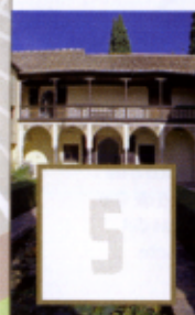
Casa del Chapiz