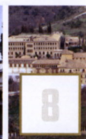
Abadía del Sacromonte