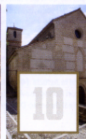
Iglesia San Juan de los Reyes