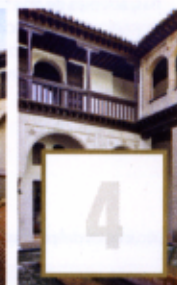
Casa Morisca Horno de Oro