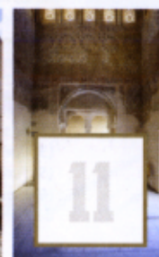
Alcázar del Genil