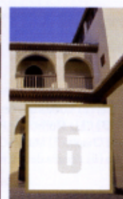
Palacio de Dar al-Horra