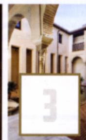
Casa de Zafra