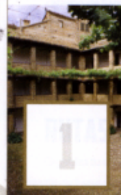
Corral del Carbón

LOS OBSEQUIOS SE ENTREGARÁN ENTRE LOS DÍAS 15 Y 21 DE NOVIEMBRE, HASTA AGOTAR EXISTENCIAS Hazte Amigo de las Tiendas-Librería de la Alhambra y consigue descuentos en todas tus compras (5% en libros y 10% en producto) además de ser el primero en conocer todas nuestras actividades.