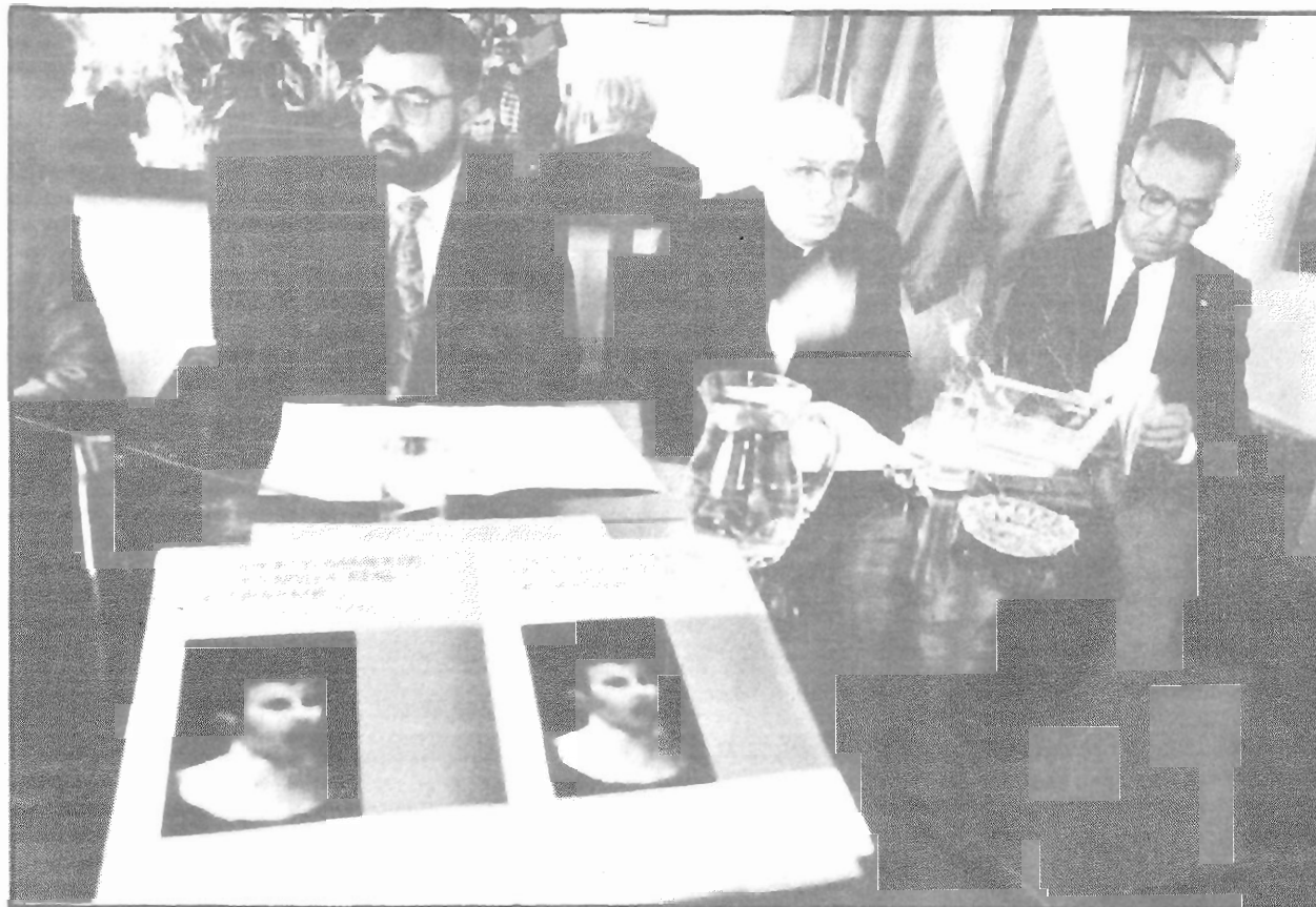
La obra de Germán Tejerizo es una de las más importantes en el campo de la musicología andaluza

En el acto de presentación, al que asistieron importantes musicólogos, se destacó la trascendencia que tienen estos estudios para rescatar la tradición