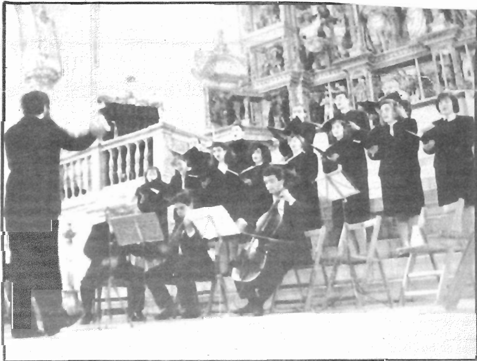
Los villancicos fueron interpretados en la Capilla Real

La rigurosa interpretación polifónica del grupo Cristóbal de Morales puso de manifiesto la riqueza de matices y tonos de estos villancicos.