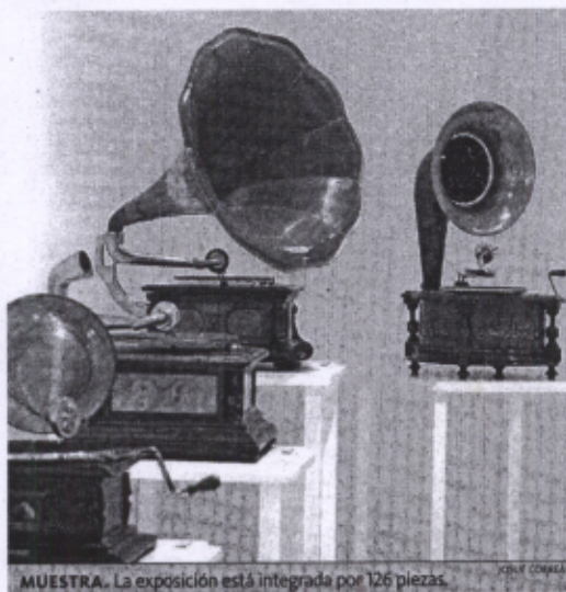
MUESTRA. La exposición está integrada por 126 piezas.

mientras que, si se avanza a una segunda fase de esta revolución, se podrá observar que "los soportes programados se han hecho en