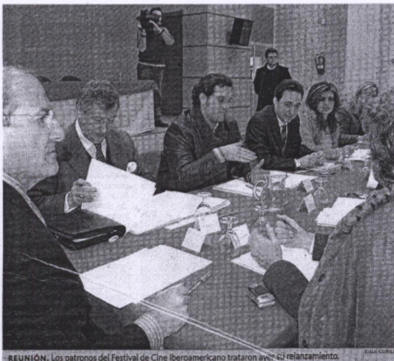
REUNIÓN. Los patronos del Festival de Cine Iberoamericano trataron ayer su relanzamiento.