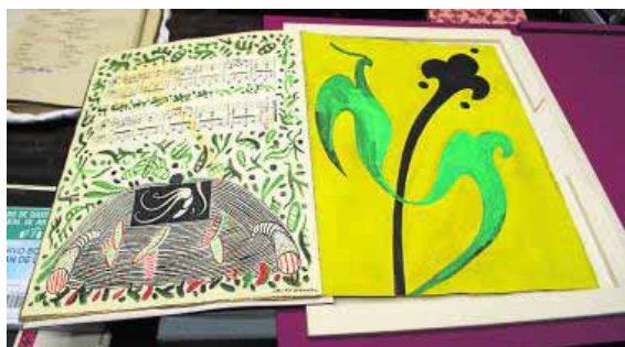
Partitura decorada por Rafael Alberti.