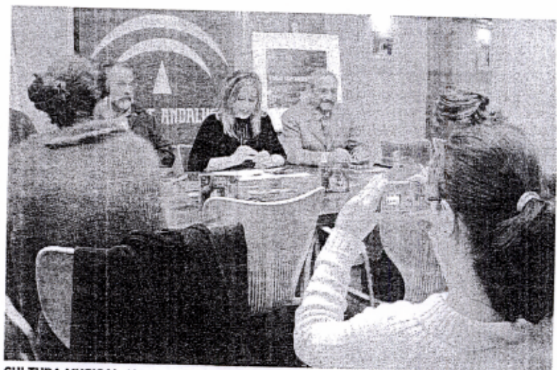
CULTURA MUSICAL. Momento de la presentación del disco.