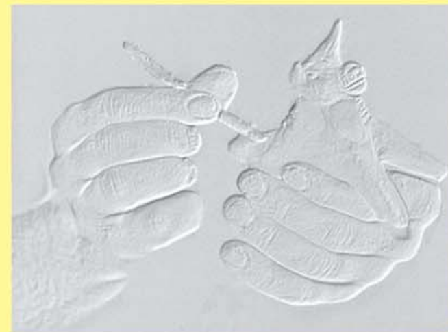
Elaboración del torico