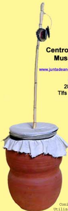
Zambomba, cangilón, tambor de fricción. Conil de la Frontera (Cádiz) Utilización: Rondas de Navidad.