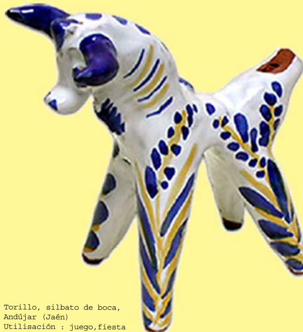
Torillo, silbato de boca, Andújar (Jaén) Utilización : juego,fiesta

La información se sintetiza, visualiza y explica a través de la fotografía y el dibujo. También forma parte de la exposición un documental, síntesis del trabajo de campo, realizado por el CDMA, que contiene : procesos de fabricación, usos de los instrumentos, grupos rituales, costumbres y canciones asociadas.