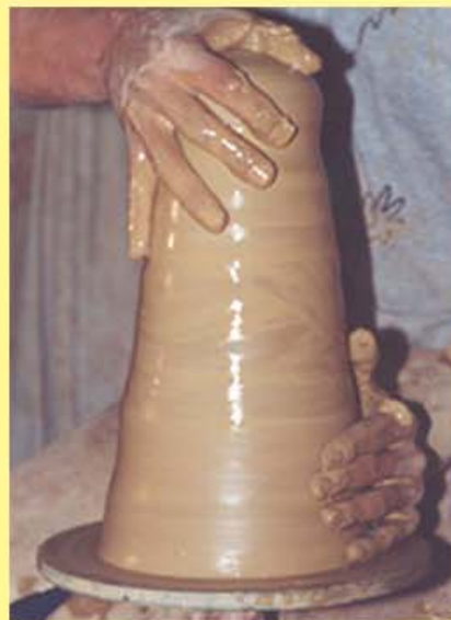
Proceso de elaboración a torno

Nuestros objetivos están orientados a las necesidades de información, educativas y lúdicas que demanda la sociedad, y pretende incentivar el estudio, el aprendizaje, el descubrimiento, la valoración y el disfrute de una parte de nuestro patrimonio musical vinculado a nuestros usos y costumbres hasta época reciente.