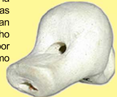
Pitillo, silbato de boca, Andújar (Jaén) Utilización : juego, fiesta

A pesar de que actualmente los instrumentos de barro, en su mayoría, ya no se usan o han sido sustituidos por otros materiales, debido a los cambios culturales y económicos producidos en la sociedad, las piezas aquí reunidas han sido durante mucho tiempo utilizadas por el pueblo como parte integrante y viva del mismo.