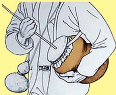
Posición de toque de la zambomba en actitud de marcha

La elaboración, los usos y costumbres asociados a estos instrumentos, forman parte de la expresión cultural del grupo y definen aspectos de nuestra identidad.