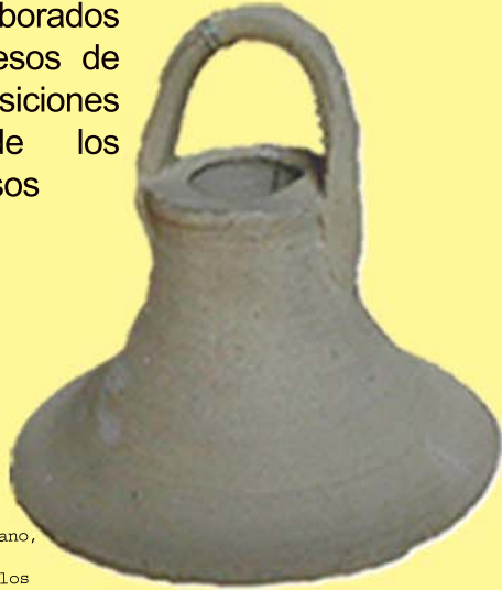
Campanica, campana de mano, Monachil (Granada) Utilización : Facundillos

Presenta instrumentos musicales elaborados en barro, procesos de elaboración, posiciones de toque de los instrumentos, usos y tipologías.