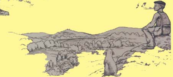
El pito o "boca" lo utilizan los pastores para guiar el rebaño y para comunicarse entre ellos.

Los instrumentos de barro se hallan íntimamente vinculados a la vida de la comunidad hasta época reciente y desempeñan funciones unidas a las diferentes actividades realizadas por el hombre.